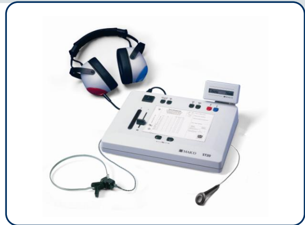
ST 20 Anzeigedisplay und SISI-Test