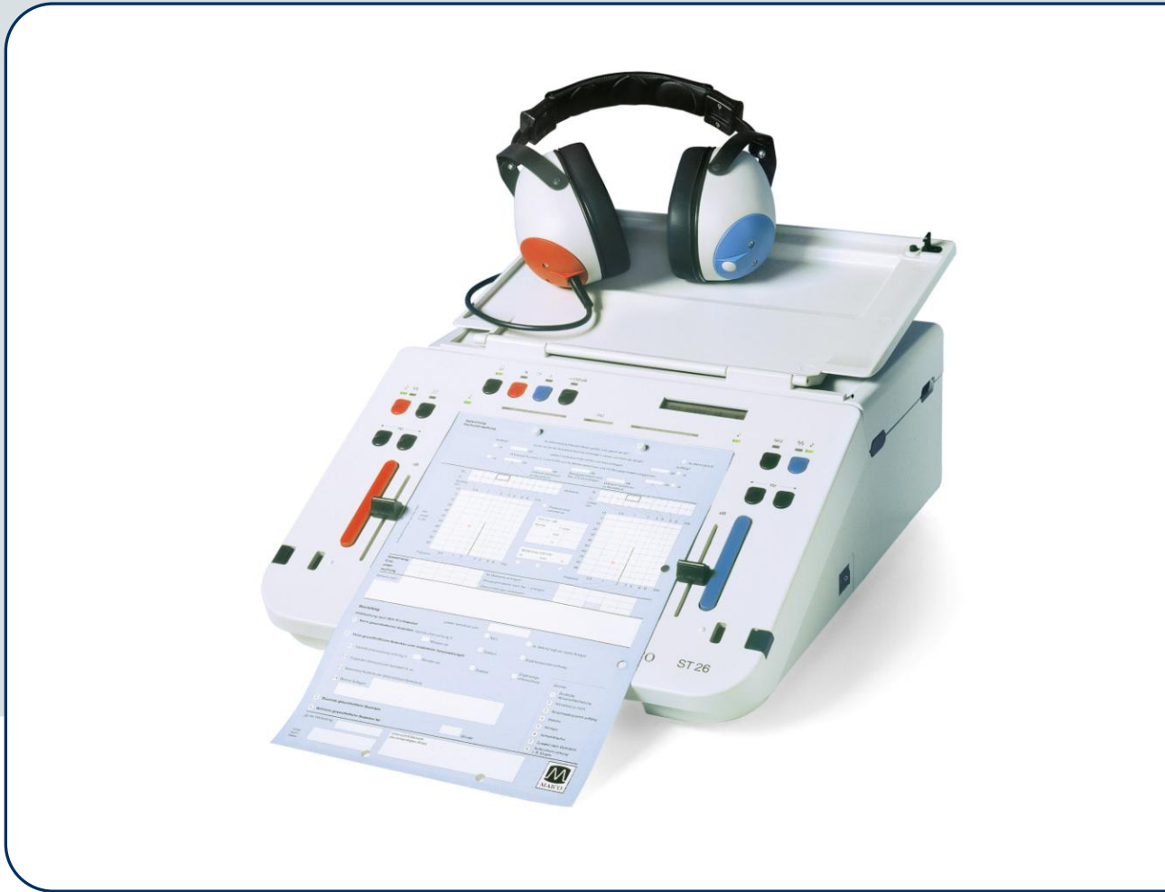
Abbildung ST 26 transportabel