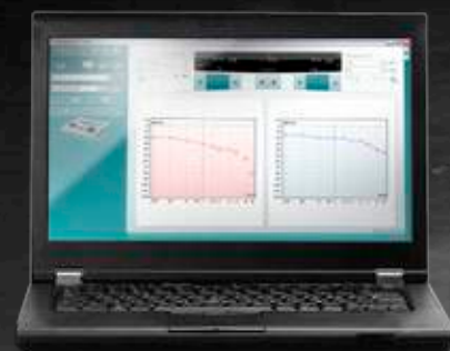
Diagnostik Suite Software (nur AS6o8e)